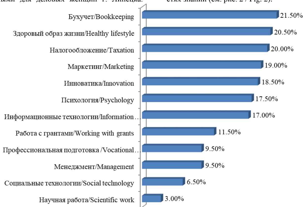
Рис. 2. Потребность деловых женщин в получении знаний Fig. 2. Need for knowledge of business women

Высокий уровень когнитивного расогласования между реальной деятельностью и базовым образованием деловых женщин вызывает у них потребность в повышении квалификации во многих областях знаний (см. рис. 2 / Fig. 2).