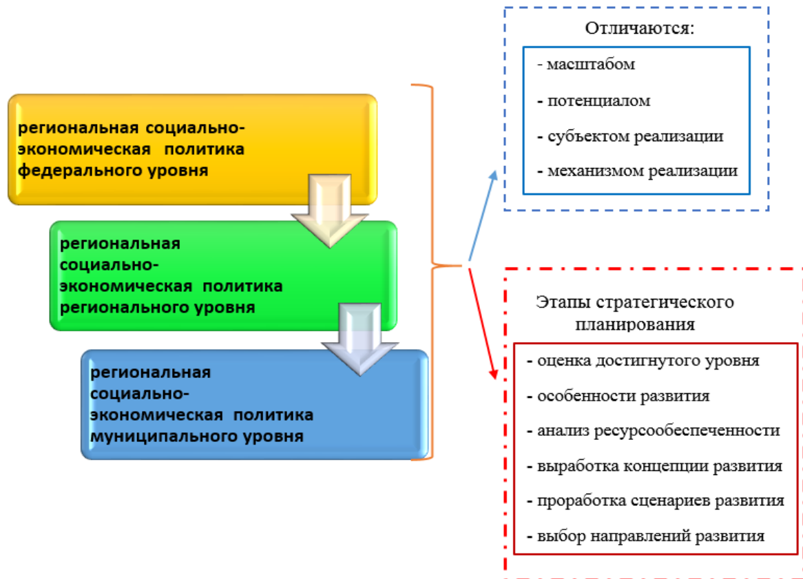
Рис. 1. Уровни разработки региональной социально-экономической политики (составлено автором по материалам [6])

на трех уровнях власти: федеральном, региональном, муниципальном [Журавлева, И. А., 2017] (рисунок 1).