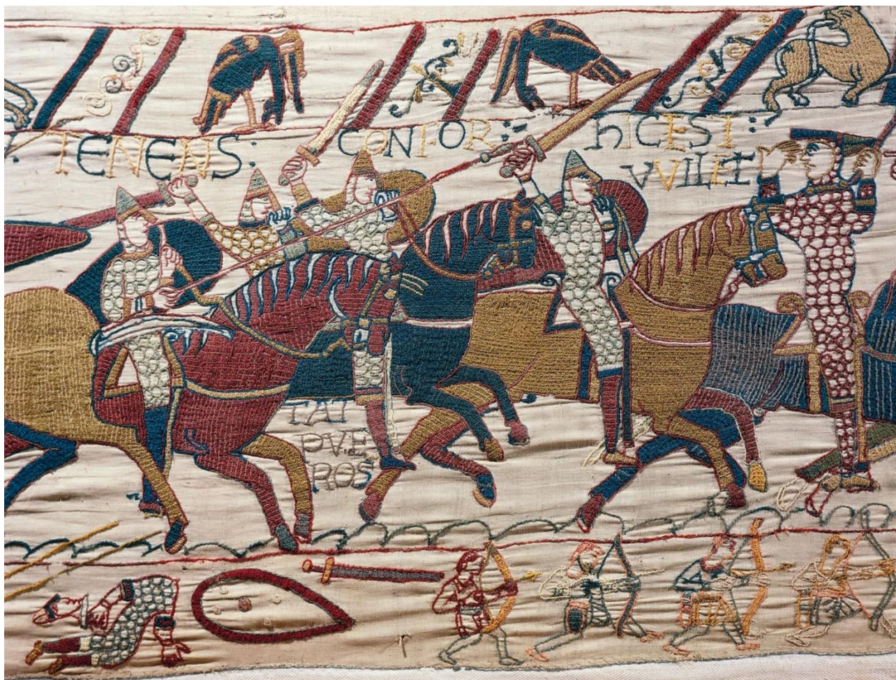
Рис. 5. Байеский гобелен (фрагмент). XI в. Шерстяная вышивка по льняному полотну.

В то же время текстиль в Средневековье способен выступать и как носитель исторической памяти. Наиболее известным примером остается Байеский гобелен, где ткань выполняет функцию хроники, соединяя изображение и надпись в единый повествовательный контур (рис. 5). Для культурологического анализа здесь важно не только содержание сюжета, но и сам принцип медиации. История фиксируется не в кодексе и не в монументе, а в ткани. Это значит, что текстиль окончательно выходит за пределы утилитарности и становится полноправным медиумом культурной памяти. Он способен удерживать событие и организовывать его интерпретацию.