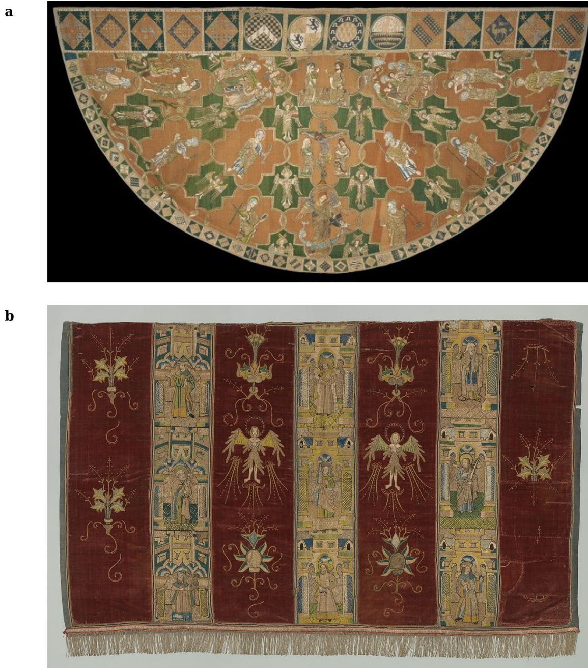
Рис. 4. Средневековая текстильная иконика: а – Сионский плащ. Англия, ок. 1310–1320. Вышивка opus anglicanum . Музей Виктории и Альберта, Лондон, инв. № 83-1864; б – Алтарный покров. Британия, XV–XVI вв. Бархат, металлическая нить. Метрополитен-музей, Нью-Йорк, инв. № 06.1199.3