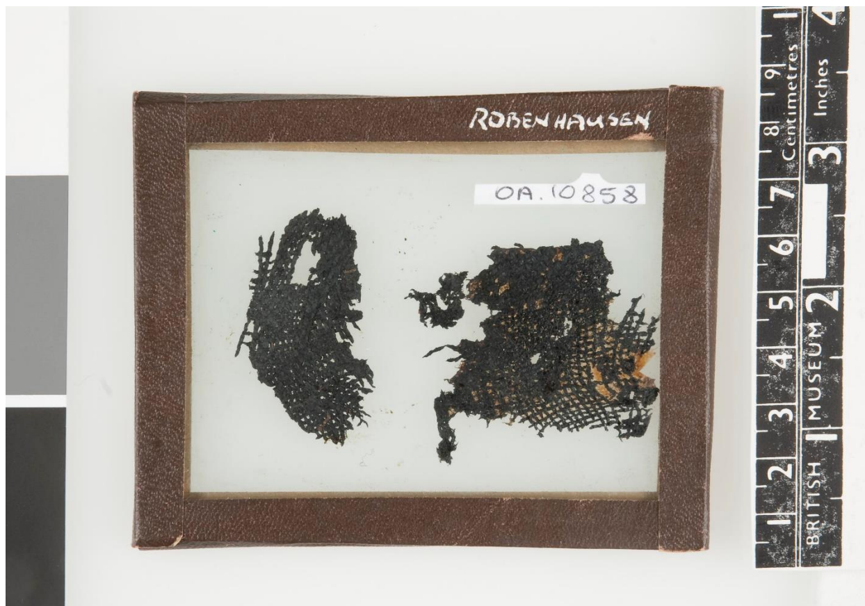
Рис. 1. Неолитические фрагменты ткани из Робенхаузена, простое полотняное переплетение.