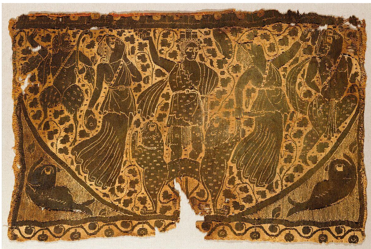
Рис. 3. Позднеантичное панно «Триумф Диониса» (IV–VI вв.), шерсть и лен, шпалерное ткачество. Метрополитен-музей, инв. № 90.5.873

С античностью связано и другое важное изменение. Ткань постепенно превращается в поверхность, способную не только обозначать статус, но и нести повествование. Развитие гобеленовых техник, сложных кайм, медальонов, бордюров и карточного ткачества означает, что текстильная поверхность начинает функционировать как носитель знаков, сюжетов и культурной памяти (см. рис. 3). Орнамент уже не сводится к украшению: он кодирует принадлежность, сообщает о ранге, иногда воспроизводит мифологические и религиозные мотивы. М.В. Терехова подчеркивает, что костюмный и текстильный ряд способны аккумулировать многослойную информацию о времени, сообществе и ценностной иерархии, функционируя как особая форма культурного письма (Терехова, 2016: 63–64). Сходную перспективу задает и интерпретация русского традиционного ткачества через категорию «орнаментального текста», семиотическая организация которого соотносится с культурной динамикой, описанной Ю.М. Лотманом (Червяков, Беляев, 2025: 350–352).