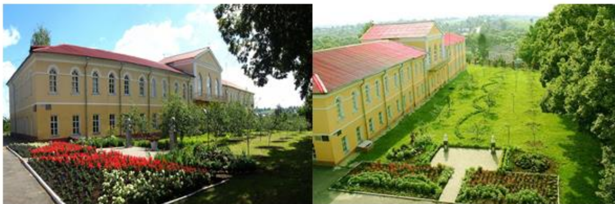
Рис. 8. Дворцовый комплекс Юсуповых в поселке Ракитное Fig. 8. The Yusupov Palace Complex in the village of Rakitnoye