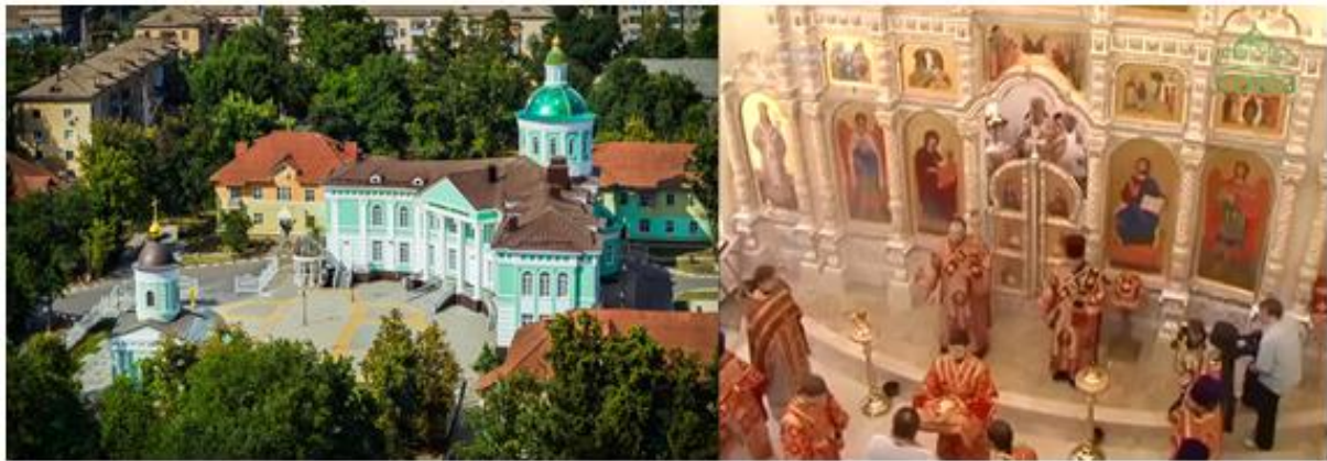
Рис. 6. Здание Белгородской митрополии Fig. 6. The building of the Belgorod Metropolia

Памятник равноапостольному князю Владимиру является крупнейшим памятником Белгорода и крупнейшим в мире памятником князю Владимиру. Его открытие было приурочено к 2000-летию Рождества Христова и 55-летию юбилею освобождения Бел-