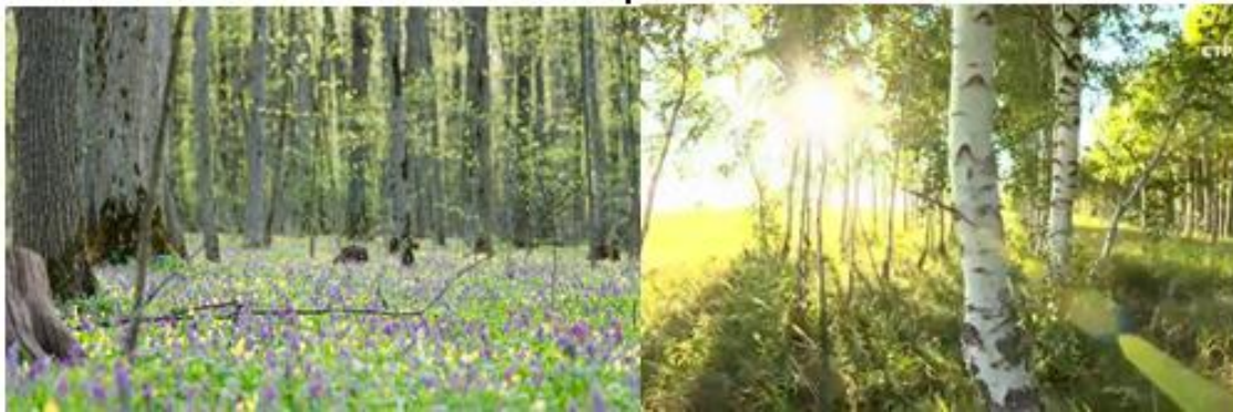
Рис. 4. Заповедник «Белогорье» Fig. 4. «Belogorye» Preserve

«Круглое здание» в селе Головчино является уникальной достопримечательностью. Представляя собой необычное архитектурное