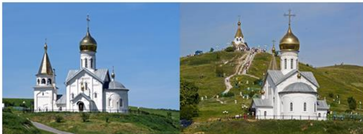
Рис. 3. Холковский подземный монастырь Fig. 3. The Underground Monastery in Kholky

Свято-Троицкий Холковский монастырь является единственным действующим пещерным монастырем в Белгородской области (рис. 3).