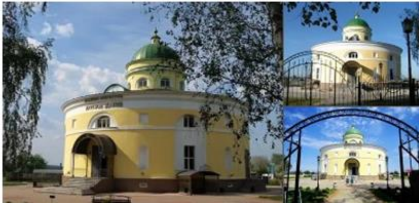
Рис. 5. «Круглое здание» в селе Головчино Fig. 5. «The Round building» in the village of Golovchino

сооружение круглой формы, здание обладает загадочной историей (рис. 5).