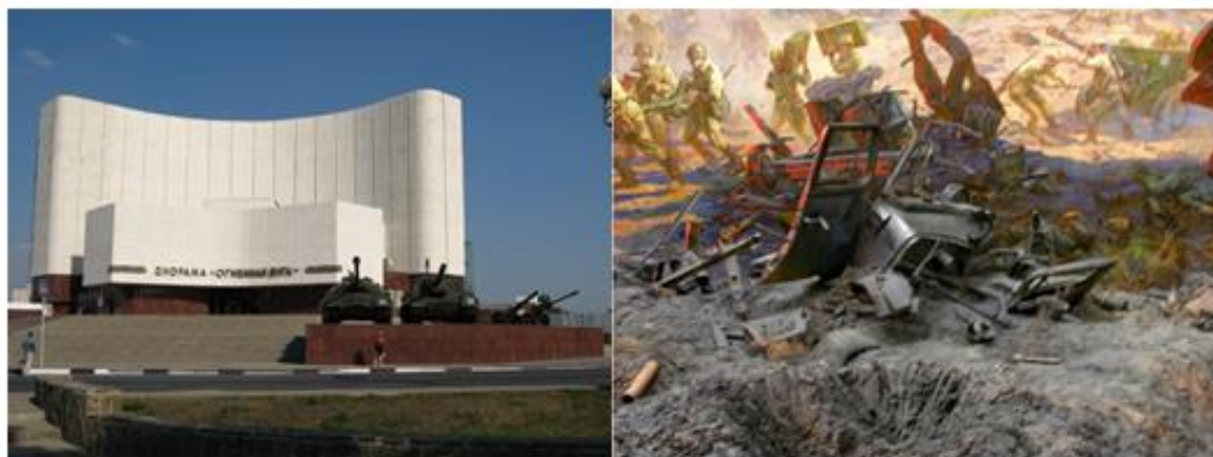
Рис. 2. Музей-диорама «Курская битва. Белгородское направление» Fig. 2. «The Battle of Kursk. Belgorod direction» Museum-Diorama