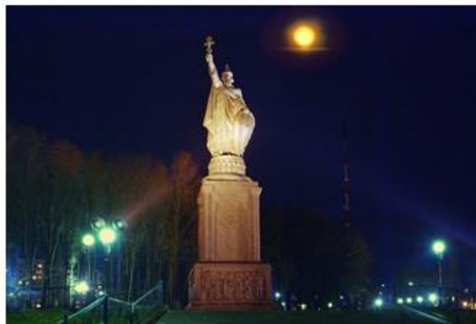
Рис. 7. Памятник равноапостольному князю Владимиру в Белгороде Fig. 7. Monument to Equal-to-the-Apostles Prince Vladimir in Belgorod

Дворцовый комплекс Юсуповых в поселке Ракитное представляет собой усадебный комплекс (рис. 8).