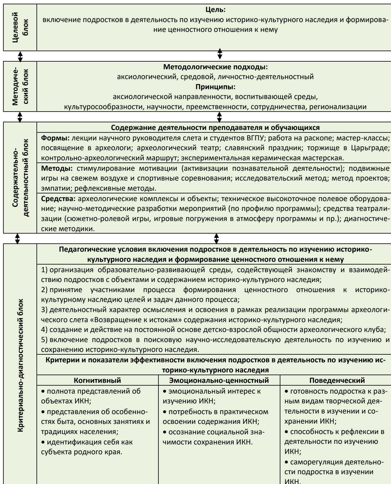
Рис. 1 Модель включения подростков в социально-ценную деятельность по изучению историко-культурного наследия