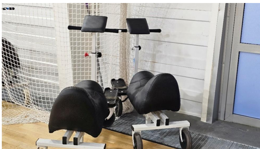
Рисунок 13. Оборудование в спортивном комплексе «Дан» Figure 13. Equipment in the Dan Sports Complex

Особый интерес в ракурсе изучения и анализа деятельности мечети и общенационального благотворительного фонда представляет их работа в местах отбывания наказания, взаимодействие с мусульманами из числа заключённых: «Деятельность духовных наставников сейчас считается продолжением воспитательной работы. Мы участвуем во многих собраниях, проводимых ФСИН республики, сами приглашаем их, кроме того, под эгидой ДУМ РТ обучаем сотрудников исправительных учреждений азам религии. Чтобы избежать конфликтов между заключёнными и сотрудниками исправительных учреждений, мы им все объясняем. Например, что при обыскных мероприятиях в мечетях на территории исправительного учреждения надо снимать обувь, нельзя разбрасывать Кораны и так далее» (муж., 35 лет, имам мечети).