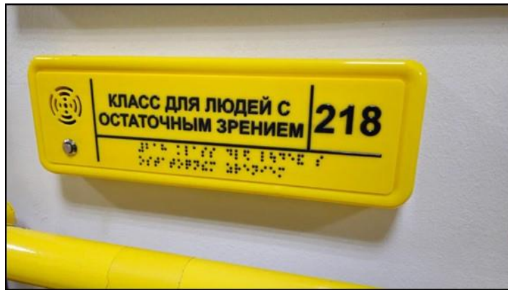
Рисунок 5. Тактильная и звуковая направляющая Figure 5. Tactile and sound guides

В центре «Ярдэм» созданы комфортные условия для пребывания людей с нарушением зрения. Здание оборудовано пандусами, лифтами, опорными поручнями, на его территории есть тактильные и звуковые направляющие, а информация на стендах и названия кабинетов написаны рельефно-точечным шрифтом Брайля (см. Рисунок 5). В первые дни пребывания в центре незрячие люди учатся самостоятельно ориентироваться в нем. Преподаватели объясняют им, как найти свою комнату и учебные кабинеты, каким образом выйти на улицу и самостоятельно дойти до магазина. Также есть библиотека с актовым залом, медицинский и массажный кабинеты, класс для людей с остаточным зрением, помещение для занятий домоводством и прикладным искусством, столовая и общежитие.