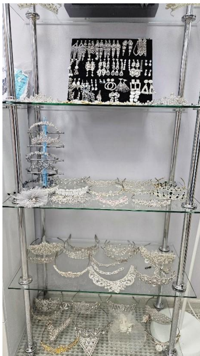
Рисунок 9. Ассортимент товаров для невест в Никах центре в мечети «Ярдэм» Figure 9. Selection of goods for brides in the Nikah Center at the Yardem Mosque