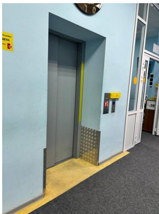
Рисунок 2. Внутри мечети «Ярдэм» Figure 2. Inside the Yardem Mosque

Корпус реабилитационного центра имеет три этажа, где расположены административные кабинеты, залы для проведения мероприятий, столовая, спальни, учебные классы, оборудованные для незрячих, кабинет релаксации и массажа с профессиональными массажными креслами и кроватями, студия звукозаписи, в которой выпускают аудио книги для незрячих. В помещениях соблюдены все нормы для проживания инвалидов (оборудованы пандусы, разноуровневые поручни, специальная мебель и т.д.).