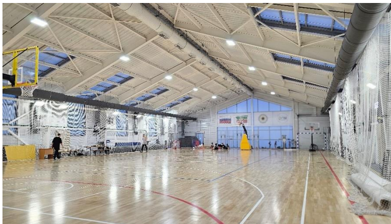
Рисунок 12. Спортивный зал в комплексе «Дан» Figure 12. Sports hall in the Dan complex