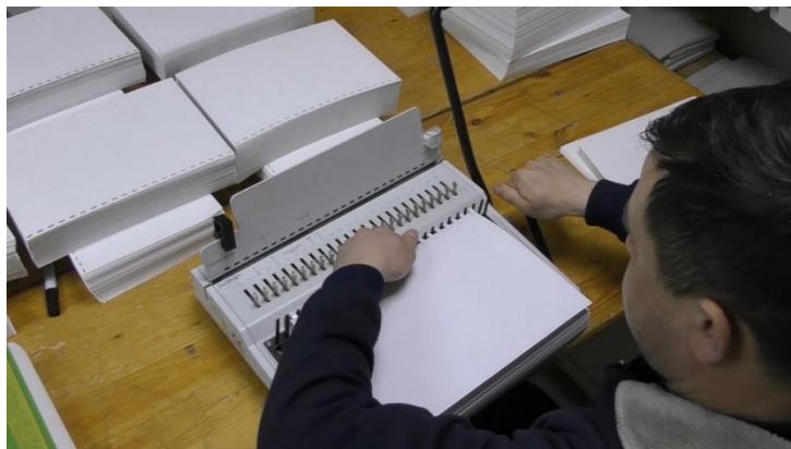
Рисунок 3. Типография в мечети «Ярдэм» Figure 3. Printing house in the Yardem Mosque

Ведет свою деятельность типография «Зур Казан» (тат. – «Большая Казань»), где тиражируются книги по системе Брайля и книги крупным шрифтом для слабовидящих людей (см. Рисунки 3, 4), также на базе типографии работает центр оперативной печати предлагающая полиграфическую продукцию, включая широкоформатную печать для всех желающих, а вырученные средства идут на издание книг для слепых. За 2024 г. было издано и роздано порядка 23,2 тыс. экземпляров книг для незрячих. Среди них не только религиозная литература (к примеру, тафсиры Корана), но также различная художественная литература и учебники на русском, татарском и арабском языках.