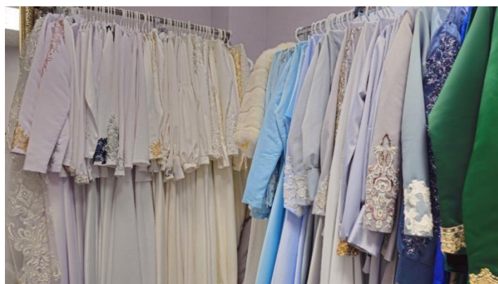
Рисунок 8. Ассортимент платьев в Никах центре в мечети «Ярдэм» Figure 8. Selection of dresses in the Nikah Center at the Yardem Mosque

Платное оказание обрядовых услуг и сопутствующего свадебного сервиса демонстрирует гибридизацию религиозного и рыночного – еще один признак десекуляризации, где мечеть становится агентом халяль-экономики, а не только местом поклонения.