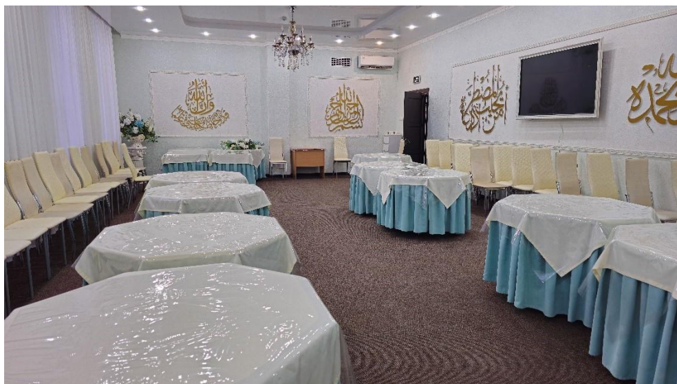
Рисунок 10. Банкетный зал для проведения торжеств в мечети «Ярдэм» Figure 10. Banquet hall for celebrations at the Yardem Mosque

Также на территории имеется шатер, где проводятся религиозные праздники и благотворительные мероприятия (например, ифтары). Шатер сдается в аренду для проведения частных мероприятий (свадьбы, ифтары, благотворительные мероприятия и т.д.) (см. Рисунок 11).