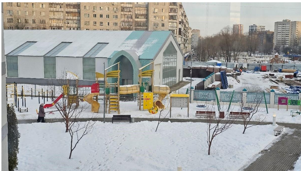
Рисунок 11. Шатер на территории мечети «Ярдэм» Figure 11. Tent on the territory of the Yarem Mosque

Рядом с мечетью находится спортивный комплекс «Дан» (тат. «Слава») – уникальное сооружение, единственное в Татарстане. Здание было построено с учетом потребностей людей с ограниченными возможностями здоровья. Само здание появилось 1 июня 2022 г. При реабилитации сотрудники фонда активно внедряют спортивные занятия, а перевозка до определенных площадок для колясочников вызывает большие трудности. К тому же не всегда эти площадки соответствуют требованиям. Именно поэтому было принято решение построить спортивную площадку при мечети.