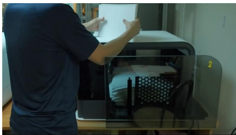
Рисунок 4. Типография в мечети «Ярдэм» Figure 4. Printing house in the Yardem Mosque