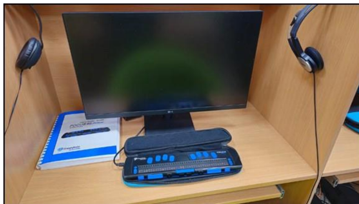
Рисунок 6. Клавиатура для незрячих Figure 6. Keyboard for the blind

В основную программу обучения незрячих и слабовидящих людей входит освоение навыков чтения и письма шрифтом Брайля, а также использования компьютера и мобильного устройства при помощи программы экранного доступа. Изучение системы Брайля позволяет незрячим людям во время работы за компьютером использовать дисплей Брайля (см. Рисунок 6). Таким образом, материальная инфраструктура центра выполняет не только утилитарную, но и семиотическую функцию: она переводит религиозное место в разряд публичных сервисов, доступных любому горожанину с сенсорными нарушениями, независимо от его веры.