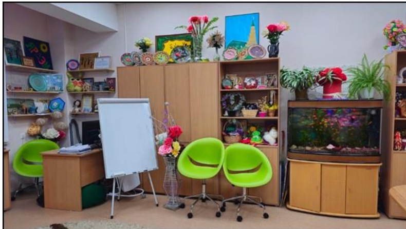
Рисунок 7. Комната, где проводятся мастер классы Figure 7. The room where the master classes are held

На уроках домоводства незрячие и слабовидящие люди осваивают необходимые им в быту навыки (см. Рисунок 7). Они учатся готовить супы, салаты, вторые блюда, следить за порядком в доме и вести домашнее хозяйство. Также преподаватели учат их шить, вязать и выставлять свои изделия на продажу, чтобы финансово поддержать себя и свою семью.