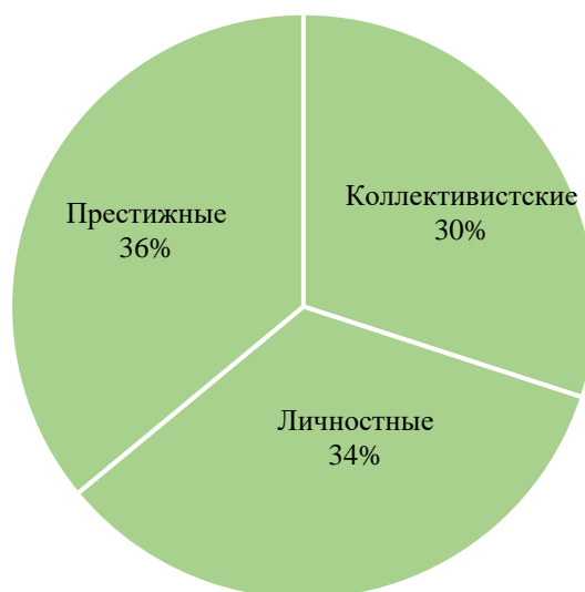
Рис. 1 Результаты первичного тестирования по методике изучения мотивов участия школьников в деятельности (%)