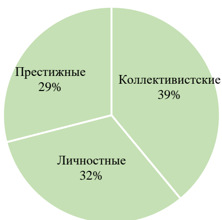
Рис. 6 Результаты повторного тестирования по методике изучения мотивов участия школьников в деятельности (%)

Далее была организована повторная диагностика по тем же методикам.