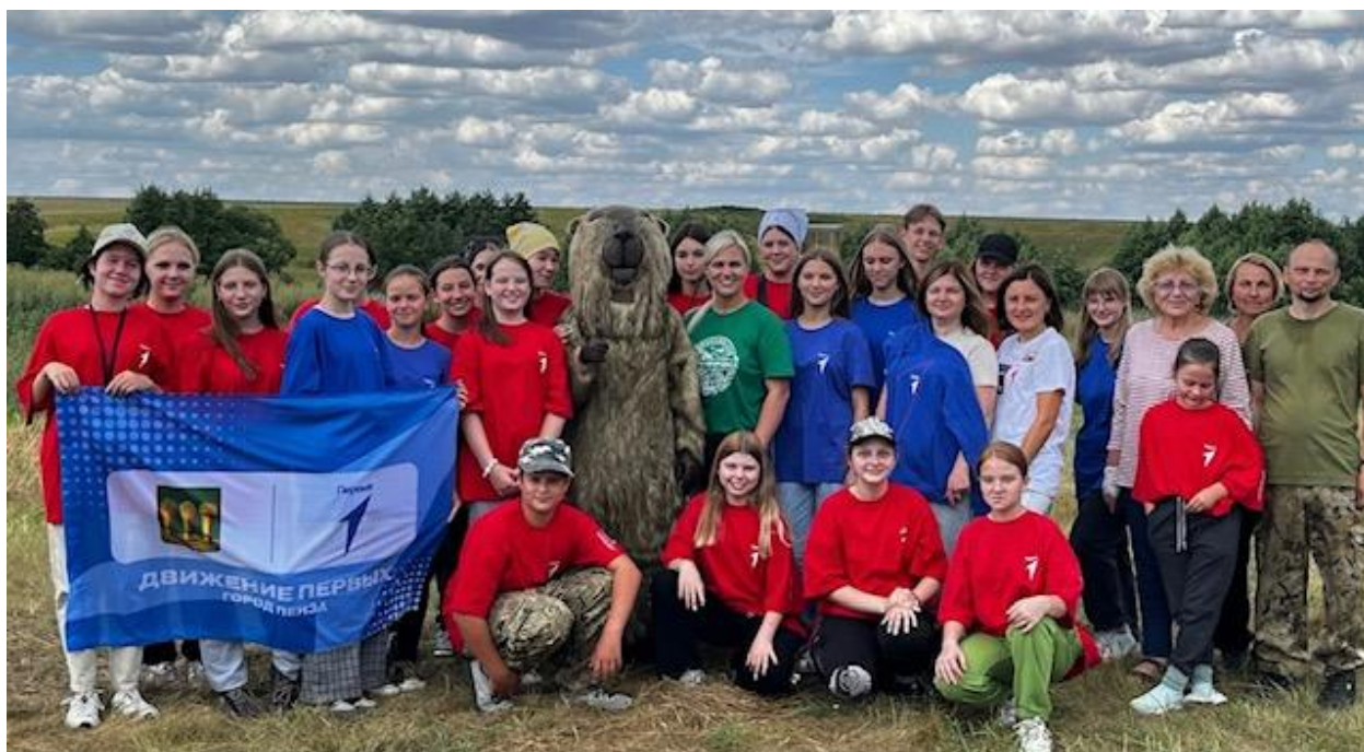
Рис. 3 Волонтерское сообщество Движения Первых Fig. 3 Volunteer's Community of the Movement of the Firsts'