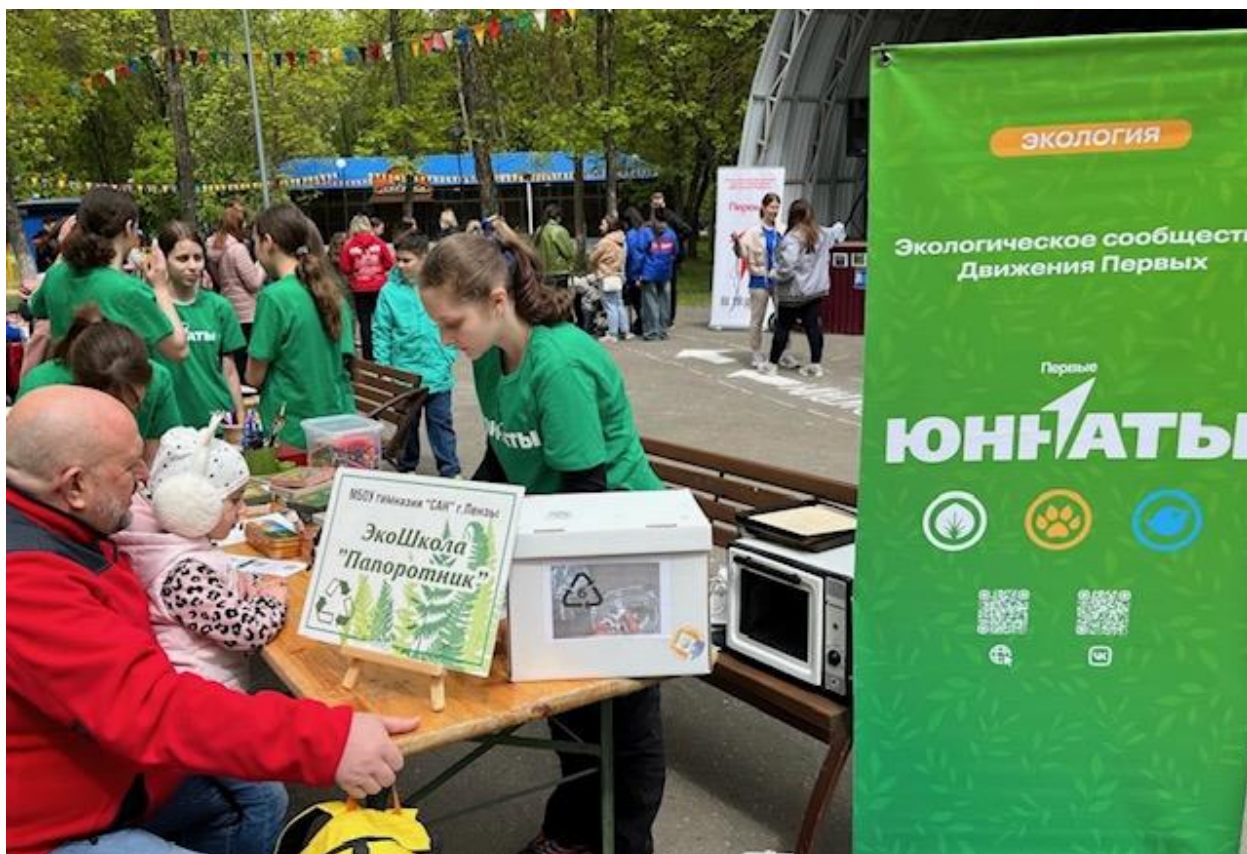
Рис. 5 Волонтерский проект экошколы «Папоротник» Fig. 5 Volunteers' Project of The Fern eco-school

Далее была организована повторная диагностика по тем же методикам.