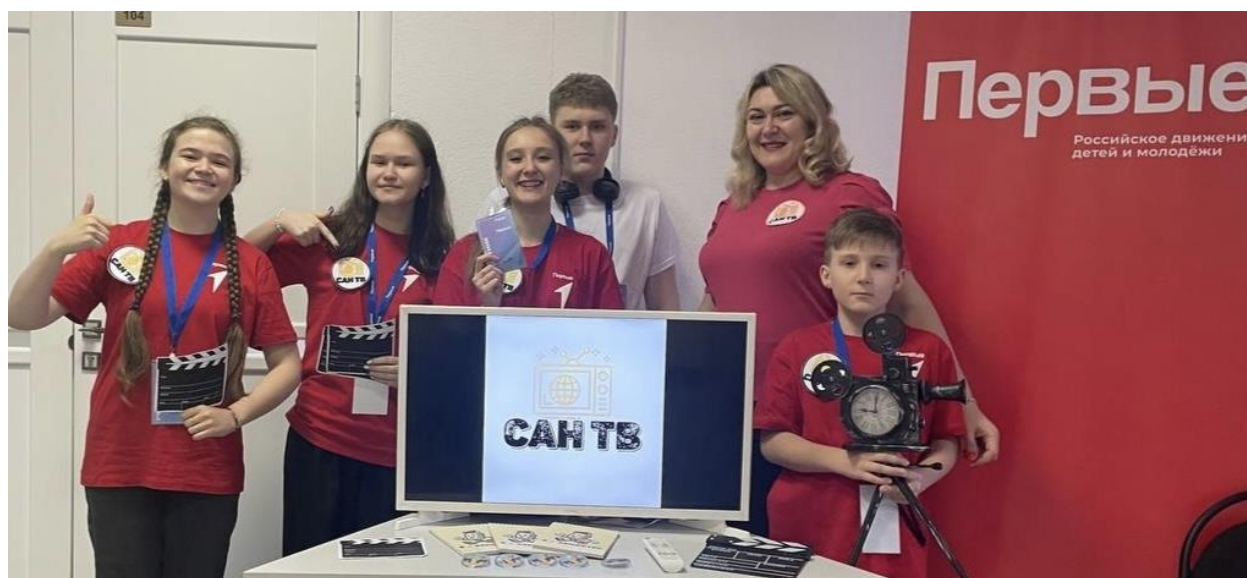
Рис. 4 Волонтерский проект школьного телевидения «САН ТВ» Fig. 4 Volunteers' project of the school TV "SAN TV"