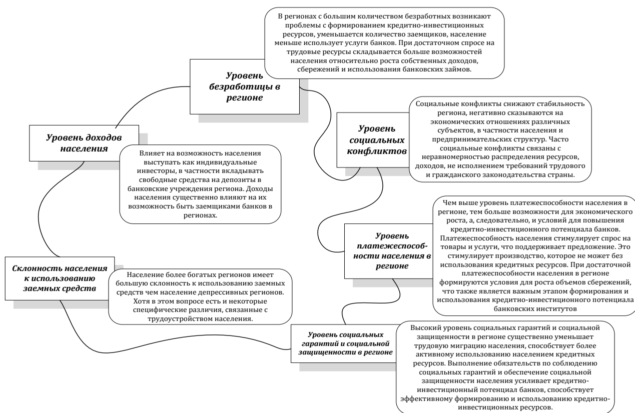
Рис. 3. Социальные особенности, влияющие на кредитно-инвестиционный потенциал коммерческих банков в регионах Украины