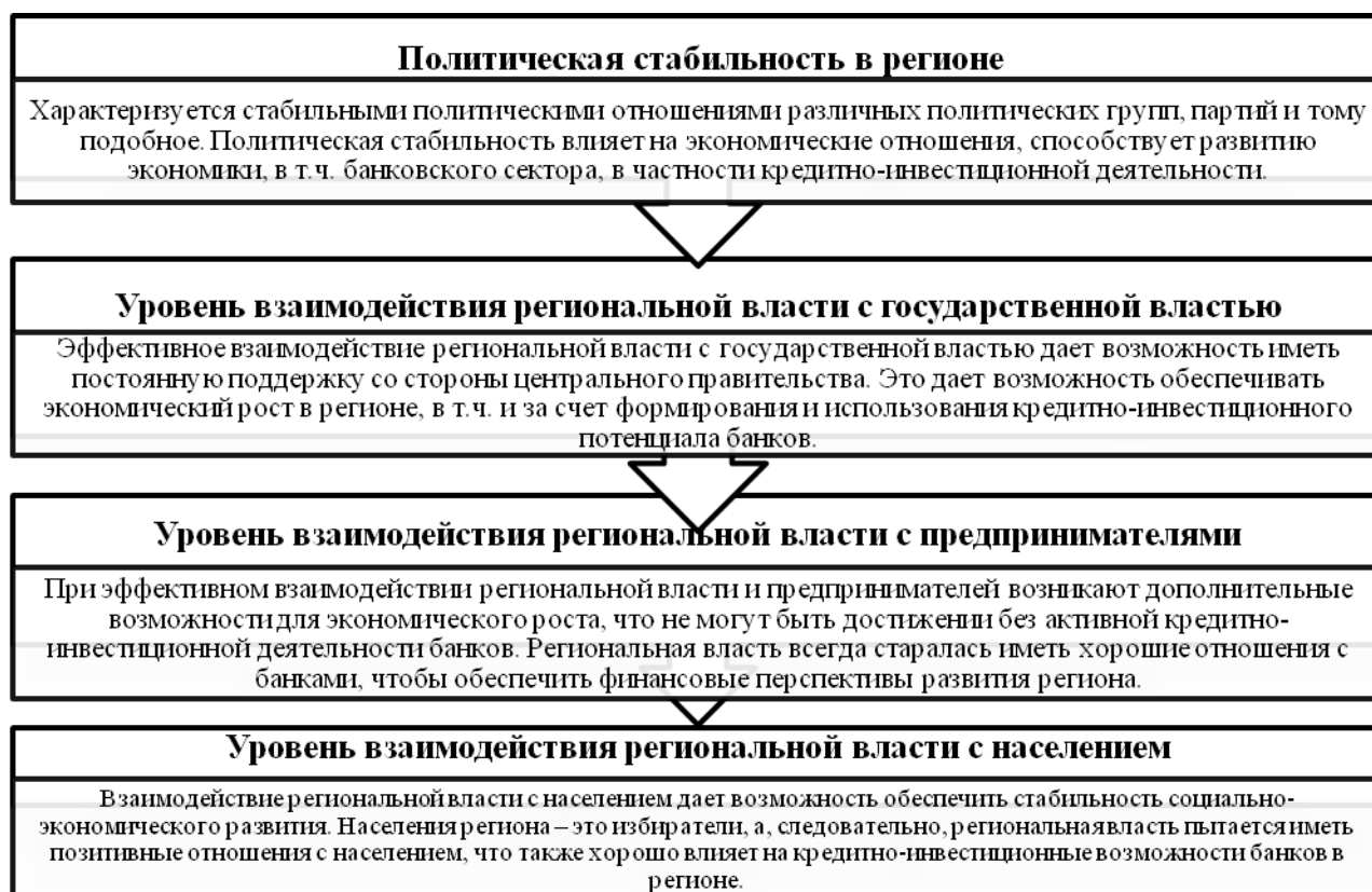
Рис. 2. Политические особенности, влияющие на кредитно-инвестиционную деятельность региональных банков Украины Fig. 2. Political considerations that affect the credit and investment activities of the regional banks in Ukraine