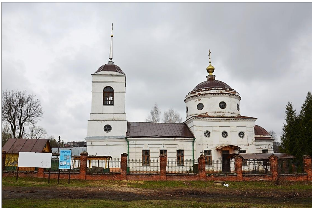
Рис. 2. Никольская церковь села Старцево (Лепешкино) (Орловский район). Fig. 2. St. Nicholas Church in the village of Startsevo (Lepeshkino) (Orel District).

От еще более давних времен в Орловском уезде под Орлом сохранились две Кузьмодемьянских луки на Кузьмодемьянском (Писцовые книги..., 1887: 1068). Запись указывает на наличие здесь некогда церкви, возможно, поставленной на отвершку в конце XV – начале XVI века, еще до сооружения Избранной радой пограничной линии, может быть, во времена Ивана III, проводившего, в том числе и по этой земле, линию ямской гоньбы на Запад.