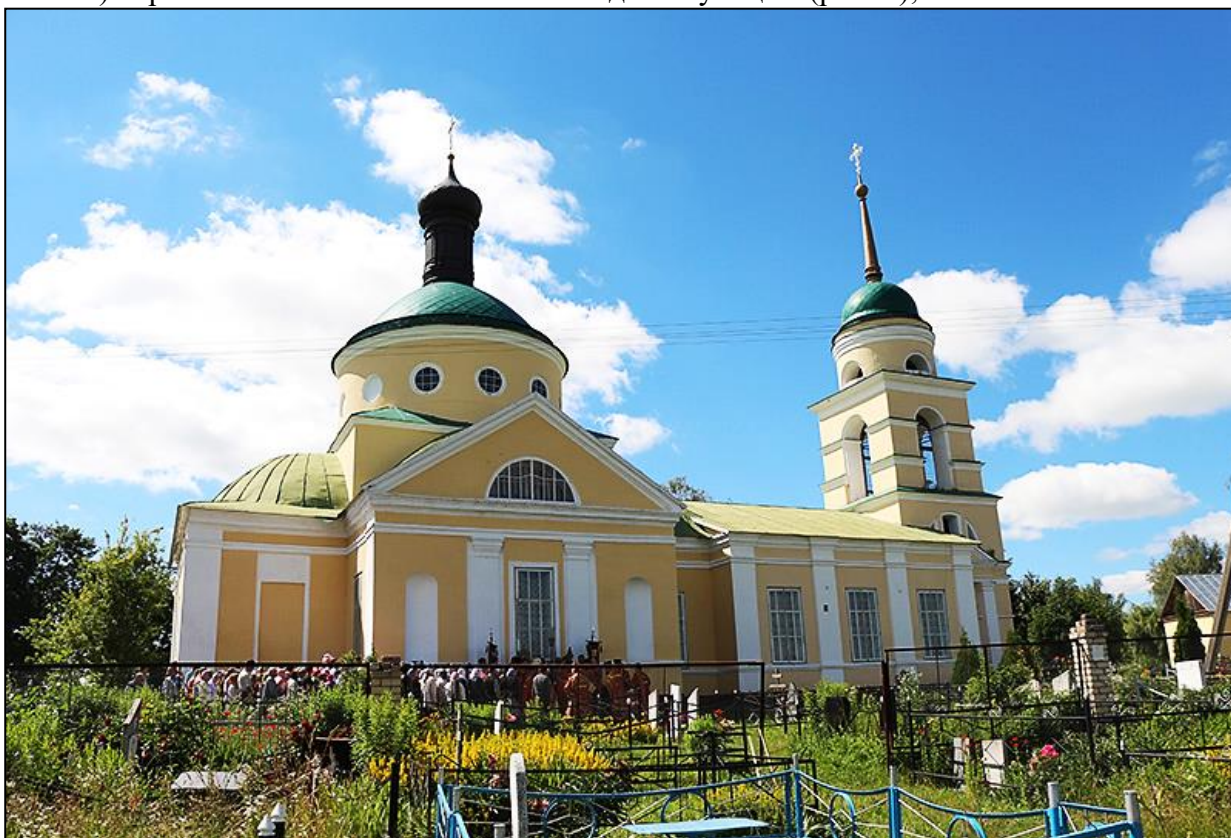
Рис. 1. Никитский храм села Солнцево (Орловский район). Fig. 1. St. Nikitsky Church in the village of Solntsevo (Orel District).

– Никитская церковь на древнем Никитском погосте в современном селе Солнцево Орловского района, отмечена в 1594 году: «Погост на земле царя и великого князя Федора Ивановича всех Руси, на реке на Орле, а на погосте церковь великого мученика Христова Никиты, деревяна, клецки, а в церкви образы и свечи, и книги, и всякое церковное строение приходных людей» (Писцовые книги..., 1887: 943). Село получило название по владельцу – князю Солнцеву-Засекину. Разоренная в Смуту церковь была поставлена на новом месте в Бекетове в 1797 году князем Д.М. Солнцевым-Засекиным. В новом каменном Успенском храме в 1801 г. был освящен правый придел во имя Святого Великомученика Никиты, а в 1843 г. – левый, во имя Святой Мученицы Параскевы. В 1870–1884 гг. по проекту архитектора В.С. Попова был устроен еще один, Архангельский придел (Неделин и Ромашов, 2009: 7). Храм является восстановленным и действующим (рис. 1);