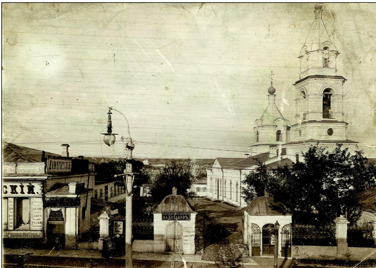
Рис. 3. Георгиевская (Сретенская) церковь, г. Орел. Ныне не существует. Fig. 3. St. George's (Sretenskaya) Church, Orel. No longer in existence.

Но даже когда были построены другие храмы, многие крестьяне и их помещики по-прежнему числились приходом к Георгиевской церкви Орла. Они являлись туда на праздники, на исповедь, на крещение, венчание, отпевание покойников, молиться за родных и т. д.